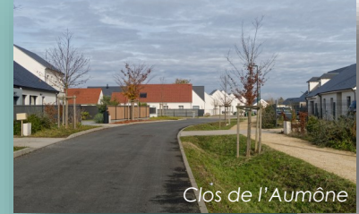
Clos de l'Aumône

Au nouveau cimetière les méthodes d'entretien ont été revues et un columbarium supplémentaire est en cours d'installation pour répondre dignement à toutes les familles.