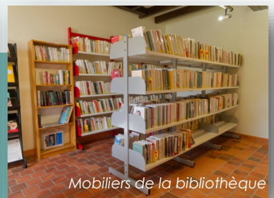
Mobiliers de la bibliothèque