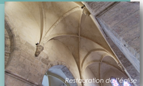
Restauration de l'église

La base de loisirs est l'objet de soins constants et fait un des attraits de notre commune. La collaboration avec le SIBCCA (syndicat de rivière) a permis une belle « renaturation » du lit du Cens et l'ouverture prochaine d'une partie des prairies entre le Cens et le canal.