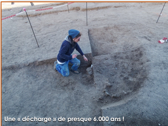
Une « décharge » de presque 6.000 ans !

On s'en souvient, des sondages archéologiques ont eu lieu en mai 2021 sur les terrains de la 2 e tranche de la ZAC du Clos de l'Aumône. La présence de vestiges avait été mise en évidence, notamment des traces d'occupation datant du Néolithique. Ces dernières ont été jugées suffisamment importantes pour justifier des fouilles préventives complémentaires, au sud de la zone (côté rue des Moulins).