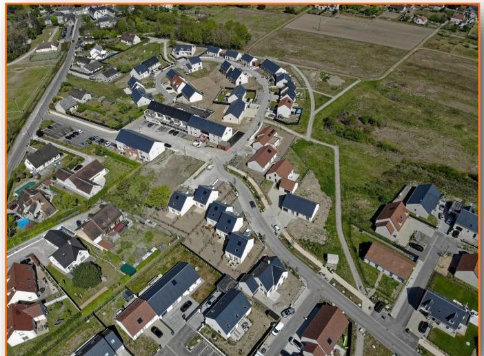
Le Clos de l'Aumône, un exemple de programme de logements programmé et maîtrisé.