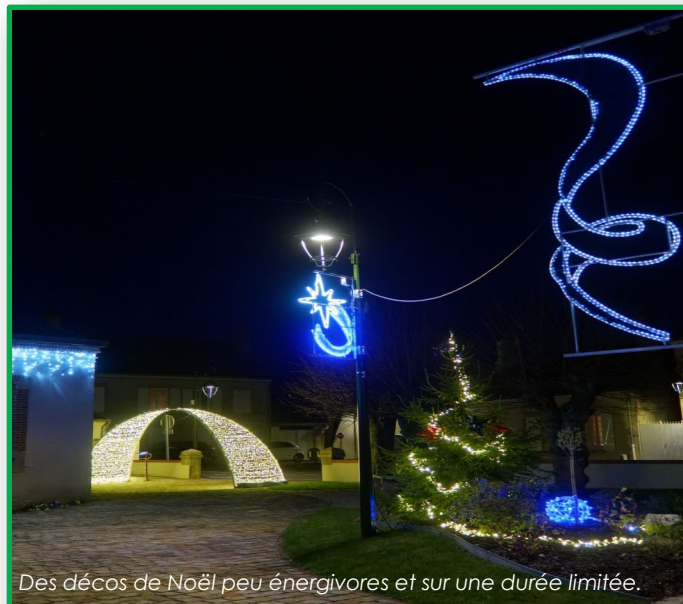
Des décors de Noël peu énergivores et sur une durée limitée.

Salles communales, gymnases et vestiaires : suivre les préconisations selon les pratiques et les publics (14, 18 ou 19 °C).