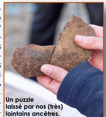
Un puzzle laissé par nos (très) lointains ancêtres.

Les fouilles, qui viennent de se terminer, ont été assurées par une équipe de chercheurs de l'INRAP et ont duré 6 semaines – qui seront suivies d'au moins 18 mois d'études en laboratoire et d'analyse des données recueillies. Les